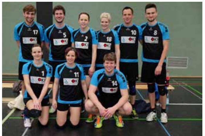
Platz 2 TV Eutingen.