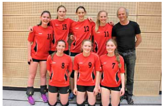
Die Siegerinnen vom Döchtbühl Gymnasium Bad Waldsee.