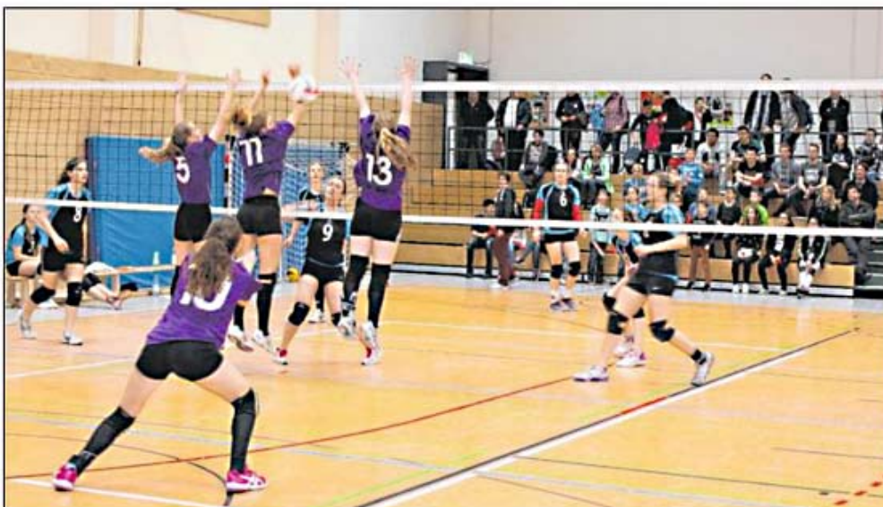
LAUTSTARK VON DEN MITSCHÜLERN angefeuert gaben die Volleyballerinnen des TMG (im lila Trikot) ihr Bestes. Am Ende reichte es für Platz vier.