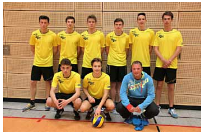
Die Sieger der Hugo-Eckener-Schule Friedrichshafen.