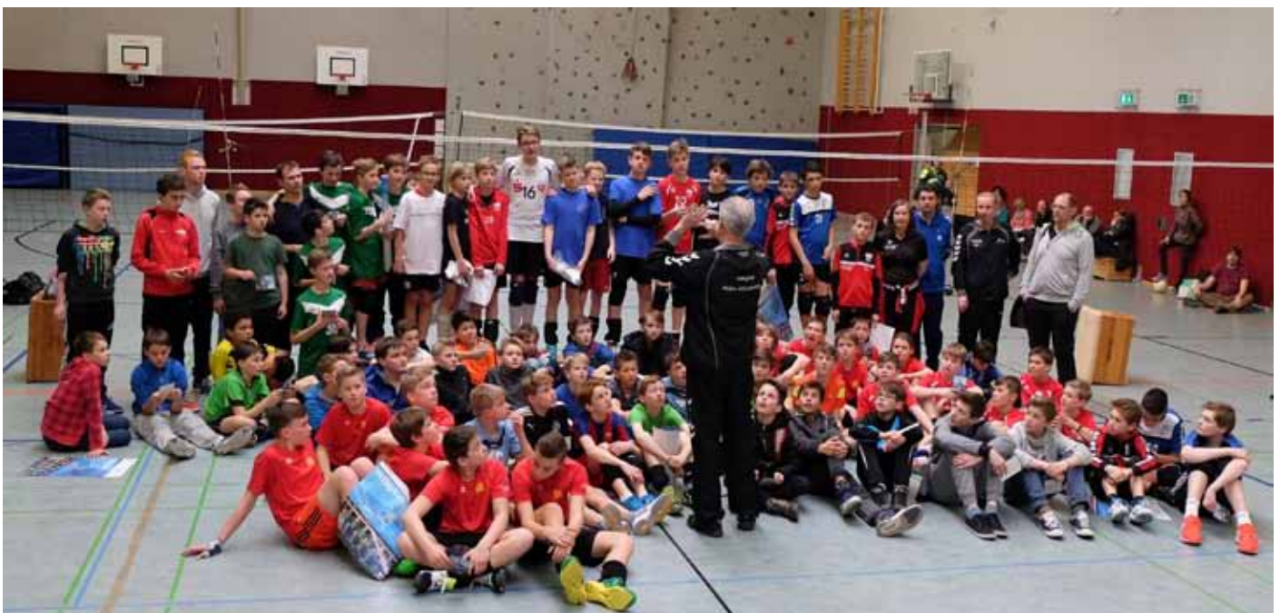
Alle Teilnehmer sowie weitere Impressionen von der Spielserie in Esslingen.