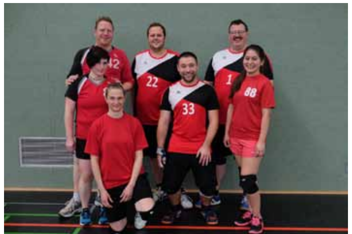
Platz 4 TV Pforzheim.