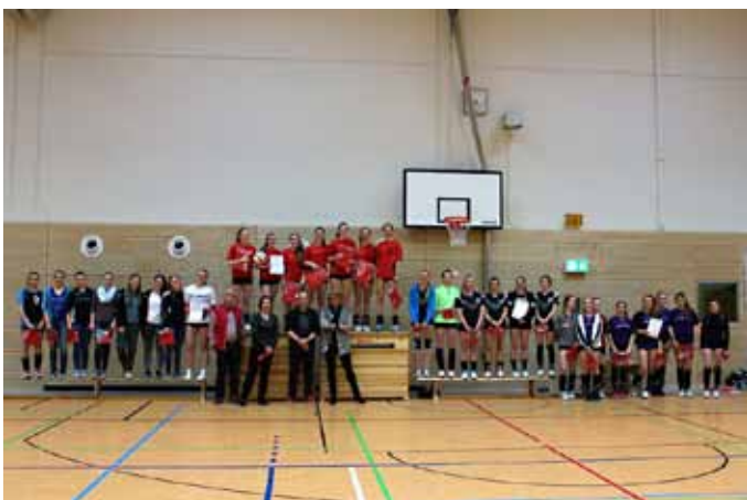
Siegerehrung Mädchen.