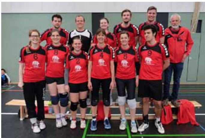
Pokalsieger 2016: SC Baden-Baden.

SC Baden-Baden - TV Eutingen 3:0 (75:34)