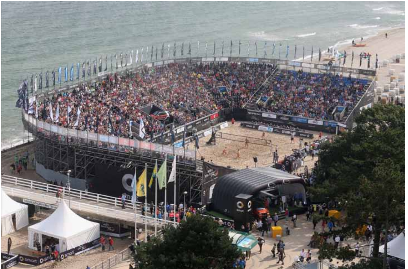
Das Mekka des deutschen Beachvolleyballs: Die Ahmann-Hager Arena in Timmendorfer Strand.

Auch 2016 können Fans bei der ranghöchsten deutschen Beach-Volleyball-Serie, der smart beach tour, und den Deutschen smart Beach-Volleyball Meisterschaften bei Sky live mitfeiern. Sky Sport berichtet von allen Finalspielen der vier smart super cups sowie umfangreich von den DM-Finaltagen in Timmendor-