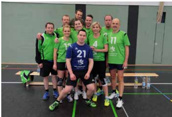
Platz 3 für TB Dillweißenstein.