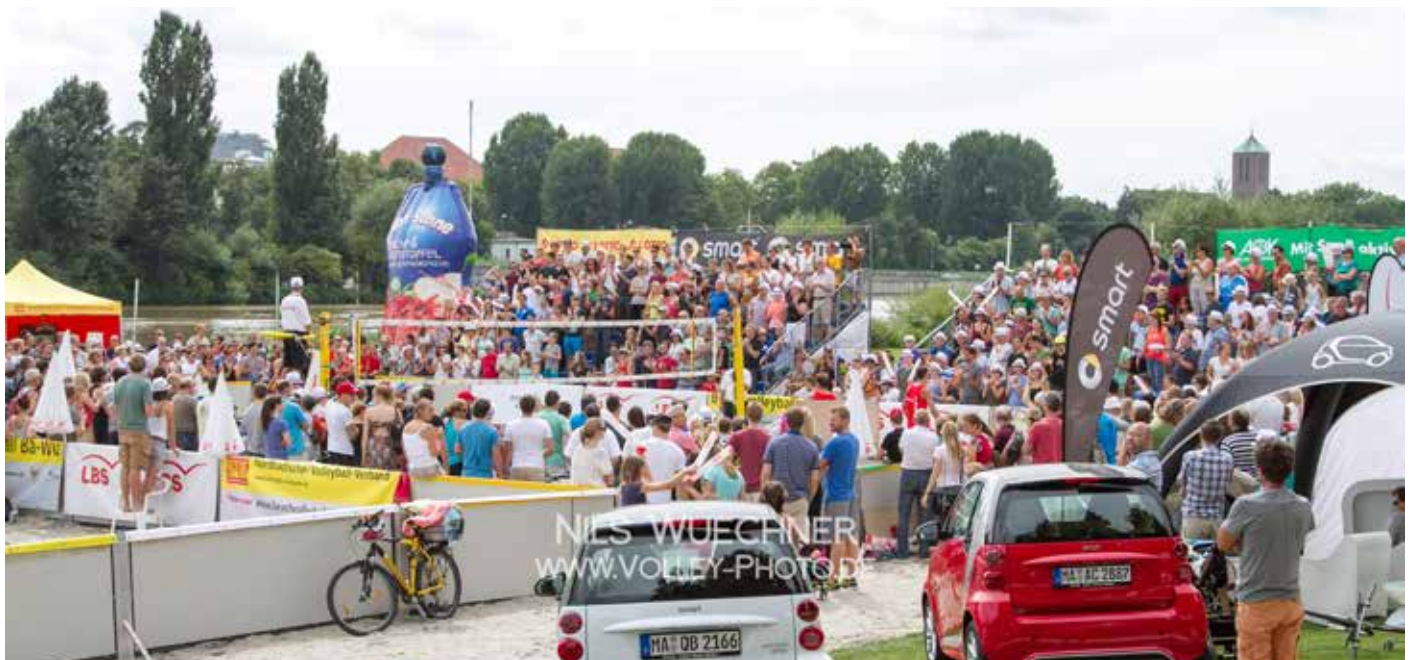
Heidelberg 2014.

Traditionell eröffnete Heidelberg jahrelang die Innenstadt Serie in Baden-Württemberg, doch 2015 wird vor der beeindruckenden Kulisse von Altstadt, Schloss, Königstuhl und direkt am Neckarufer – der Heidelberger Flaniermeile – das Beachturnier zusammen mit dem Schaufenster des Sports und dem Rollstuhl-Marathon stattfinden. Am Sonntag ist daher die Neckarwiese Treffpunkt der Heidelberger Sportfans. Ein Ausflug mit der ganzen Familie ins Naherholungs-Eldorado Neckarwiese lohnt sich also!