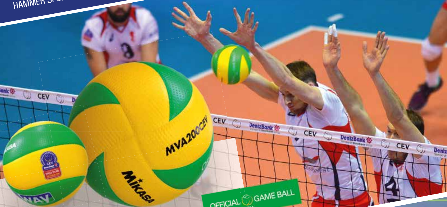
MVA 200 CEV Offizieller Spielball der Champions League

Bezug nur über den einschlägigen Fach- und Spezialversandhandel! HAMMER SPORT AG, Von-Liebig-Straße 21, D-89231 Neu-Ulm | Tel.: (0731) 974 88 -0 | www.mikasa.de