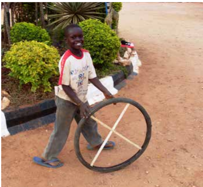
Bild 10: Junge mit Speichen verstärktem Fahrradmantel (Die Zeitung in der Gesäßtasche dient als Treibstock – man achte auf die Flip-Flops, vielleicht sollen diese noch bis zur Hochzeit halten ...).