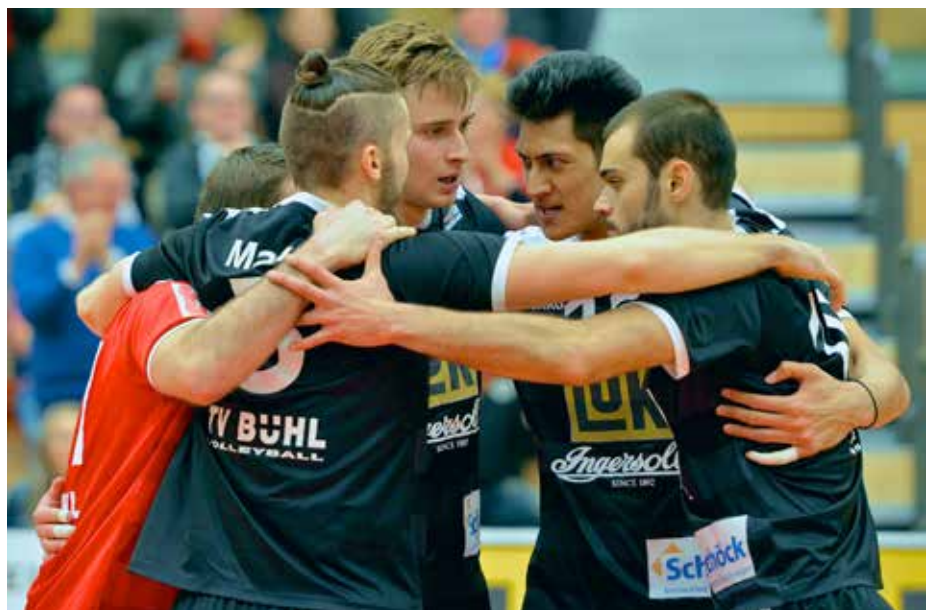
Der Teamgeist stimmt beim TV Bühl.