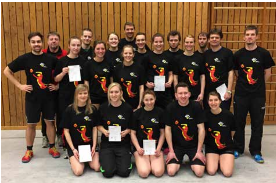
Die erfolgreichen Teilnehmer der C-Trainer-Ausbildung von NVV und SbVV in Steinbach im März 2015.