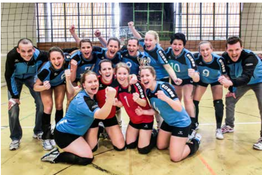
Die Pokalsiegerinnen der VSG Ettlingen/Rüppurr.