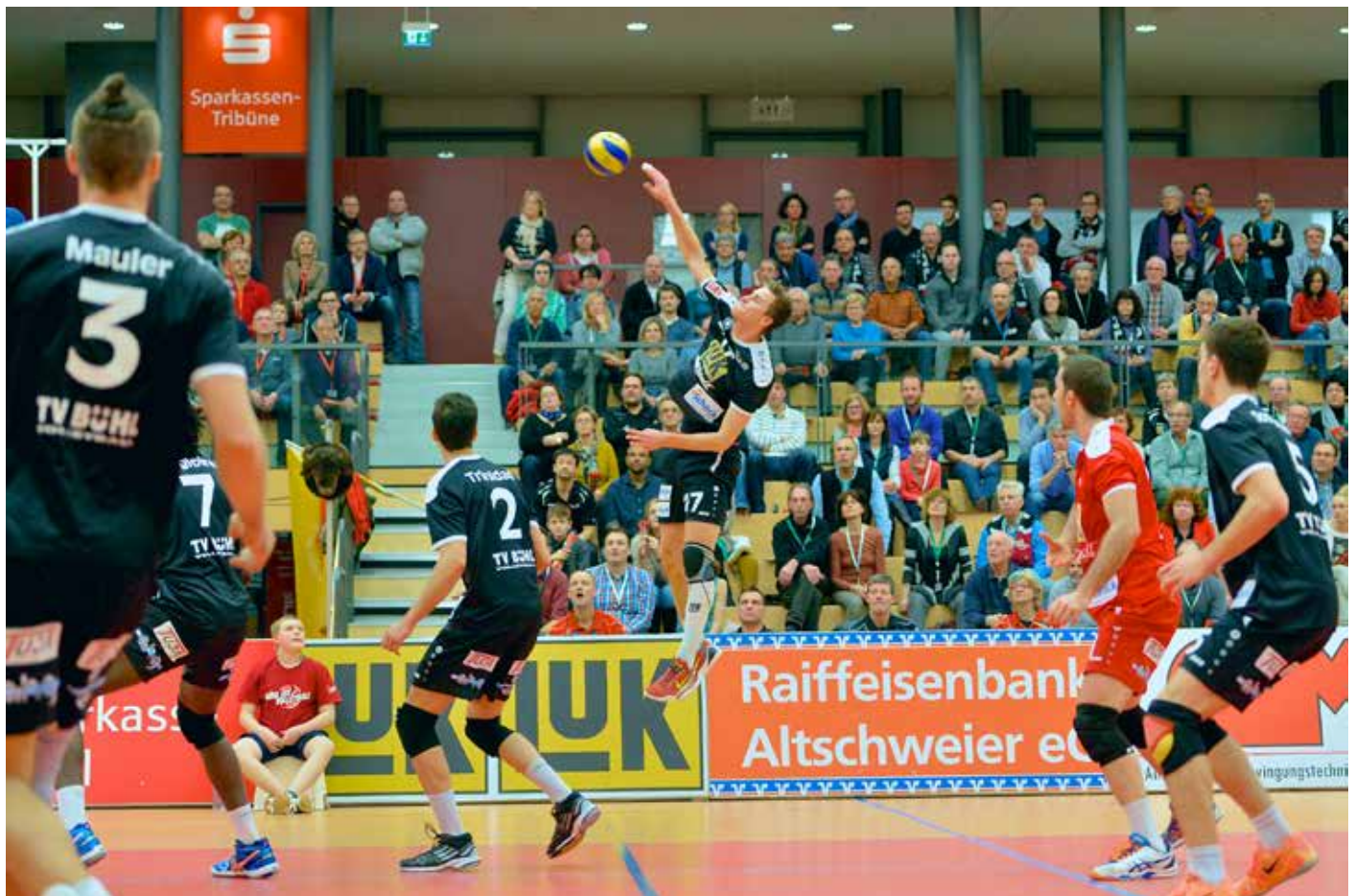
Ein gutes Zusammenspiel prägte die Spielpartien der Bisons in der Hauptrunde.

Im Anschluss an die am 21. Februar so erfolgreich beendete Hauptrunde stand für die Bisons jedoch erst einmal eine dreiwöchige Spielpause bis zum nächsten offiziellen Match an. Von echtem Pausieren während der Erstliga-Betrieb bis zum Beginn der Playoffs ruhte, konnte für Wolochins Schützlinge jedoch keine Rede sein, denn die Mannschaft nutzte diese Zeit nach Auskunft ihres Trainers für ein um-