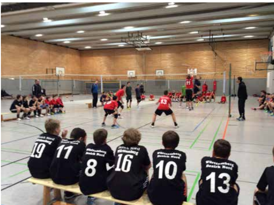
Spielserie in Tübingen.