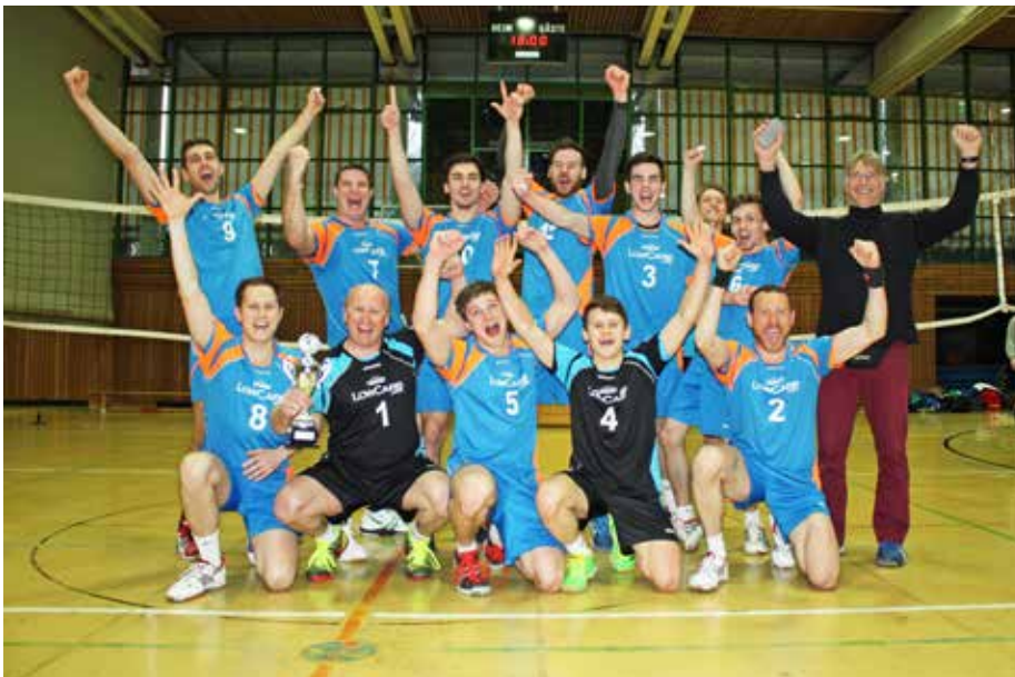
Die Pokalsieger des TV Flehingen.

Glückwunsch an die Bezirkspokalsieger 2015, die VSG Ettlingen/Rüppurr bei den Damen und der TV Flehingen bei den Herren!