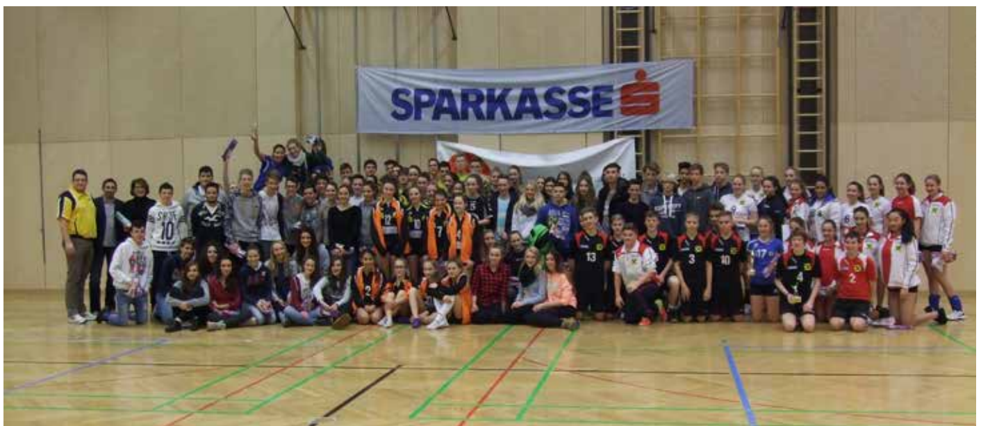
Feldkirch 2015.

Gegenüber der Maßnahme in Italien war das BaWü-Team mit anderen Zuspielerinnen und neuer Libera gestartet und steigerte sich von Spiel zu Spiel. Im Halbfinale gegen Rankweil wie auch im Finale gegen Dornbirn musste jeweils einer Satz-niederlage nachgelaufen werden; dann war aber der jeweils schwache Start überwunden. Auf der Basis guter Aufschläge, im Turnier zunehmend mit strategischen Aufgaben, einer für die Altersklasse guten Annahme und variablem Zuspiel wurde im Angriff über alle Positionen gepunktet. Im K II wurde vor allem die Abwehr immer besser und die Mannschaft fand