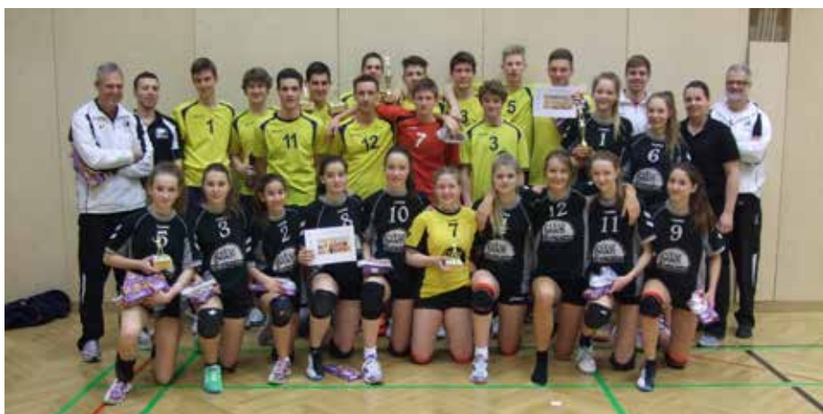
Die Ba-Wü.-Auswahlen in Feldkirch 2015.