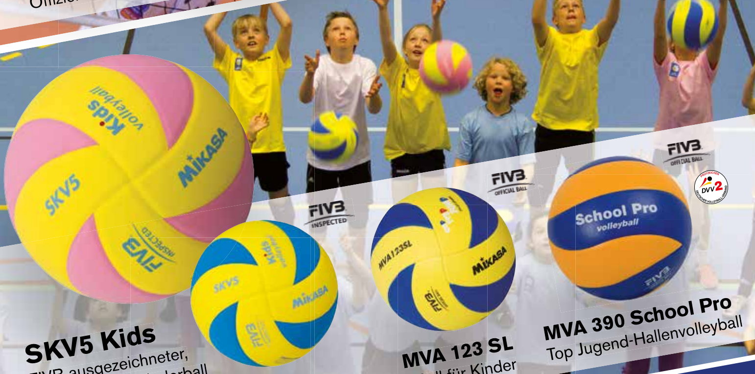
SKV5 Kids FIVB ausgezeichneter, ultra leichter Kinderball