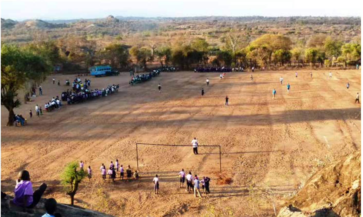
Bild 1: Fußballspielen auf dem geplanten Fußballplatz.

Truppen bekämpfen Al Shabaab, die inzwischen halb Somalia unter ihrer Kontrolle hat, bereits seit Jahren im eigenen Land um das Übergreifen dieser radikalen Organisation auf Kenia zu verhindern. Aufgrund dieses „Küstenkrieges“ ist der Tourismus an der Küste Kenias zum Teil zum Erliegen gekommen. Einige Reiseunternehmen hatten im Frühjahr ihre Touristen ausgeflogen und Flüge nach Mombasa bis Oktober 2014 storniert. Das Deutsche Auswärtige Amt sah die Situation nicht so dramatisch wie England, veröffentlichte jedoch detaillierte Reisewarnungen. ... und genau in diese explosive Ecke wollte ich im Sommer 2014 mit 31(!) Studierenden. (Ich berichtete darüber in VIN, 2014, 1, S. 8-10).