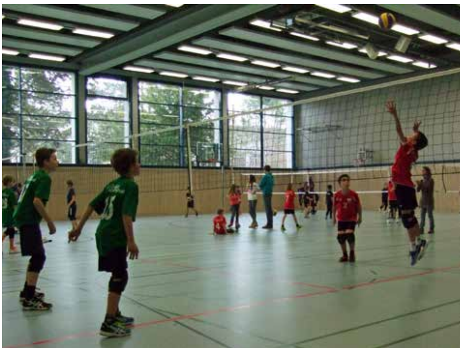
Spielezene in Radolfzell.