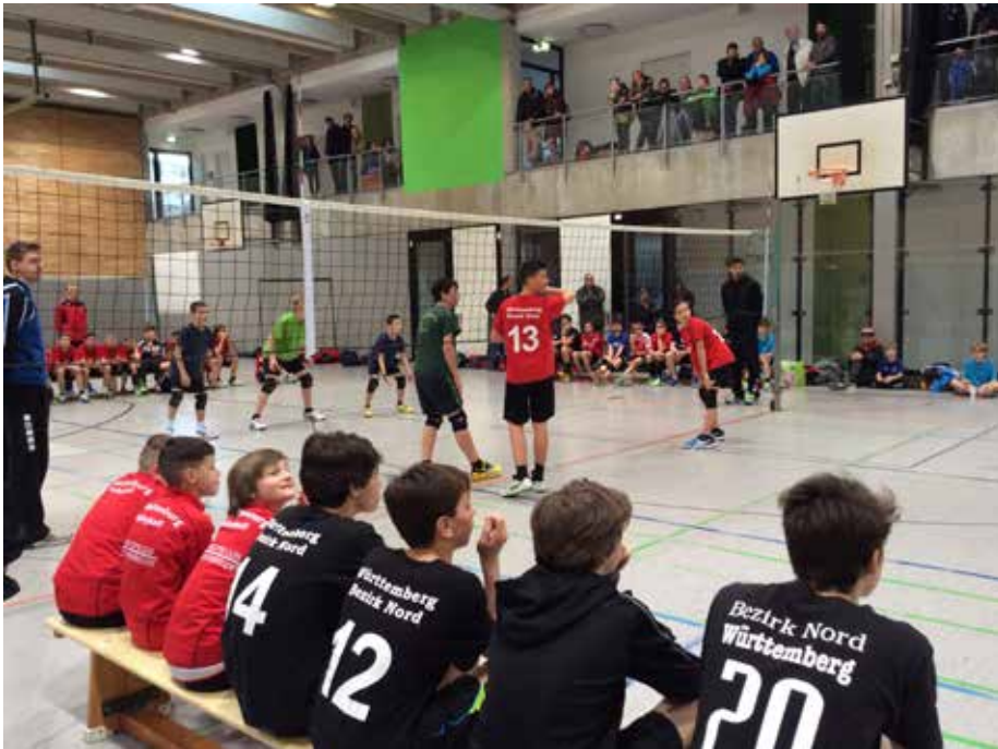
Spielserie in Tübingen.